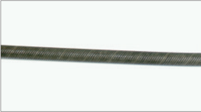
Axeln kan köras åt båda hållen. Den finns från 6 mm - 12 mm.